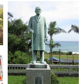
屋久島の海を背景に 創始者 柴 昌範像