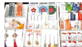
屋久島大社オリジナルお守り