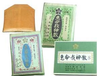
パッケージの変遷

1933年（昭和8年）に鹿児島で販売開始したことをきっかけに、1938年（昭和13年）には東京へ進出。その後、海軍にも納入をされるようになりました。配置薬として家庭に普及され、今では薬局やドラッグストアでも販売しています。