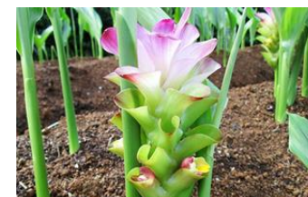
5月-6月ガジュツの花